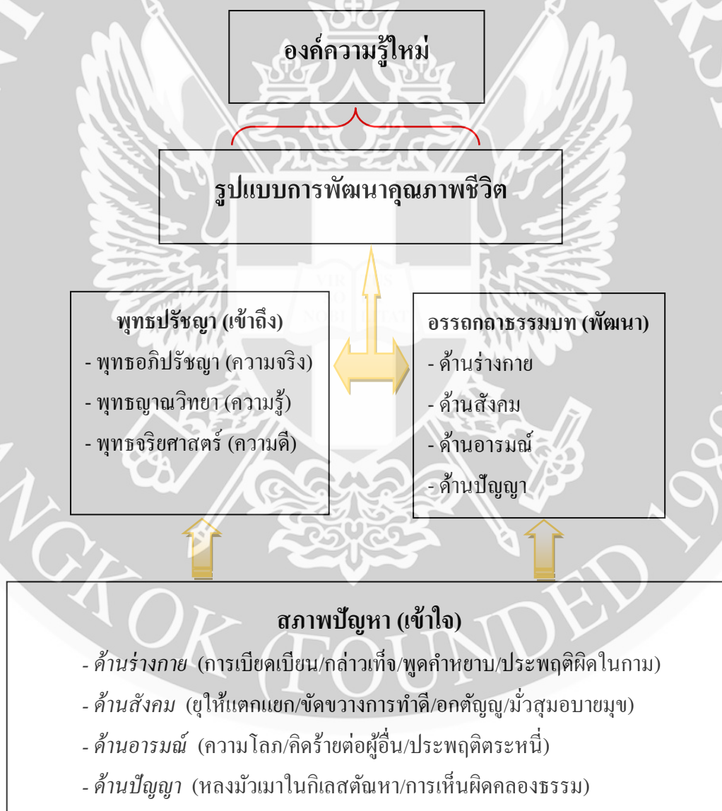
ภาพที่ 1 กรอบแนวคิด

หลังจากที่ผู้วิจัยได้รวบรวมประมวลในกระบวนการเดินเรื่องต่าง ๆ จึงทำให้เกิดการนำมาสู่การจัดระบบเป็นกรอบแนวคิด เริ่มต้นด้วยประเด็นการศึกษาให้เข้าใจสภาพปัญหาทางสังคม แต่ละด้าน ว่าควรจะแก้ด้วยเครื่องมือคืออรรถกถาธรรมบท ที่เป็นไปในเชิงพุทธปรัชญาทั้ง 3 หลัก โดยอาศัยกรอบการพัฒนาทั้ง 4 ด้าน มุ่งชี้ให้เห็นสารัตถะในอรรถกถาธรรมบท เพื่อเป็นรูปแบบให้เข้าถึงการแก้ปัญหาดังกล่าว นำไปสู่การพัฒนาคุณภาพชีวิต จนก่อให้เกิดองค์ความรู้ใหม่ ซึ่งผู้วิจัยจะได้อภิปรายในบทต่อไป