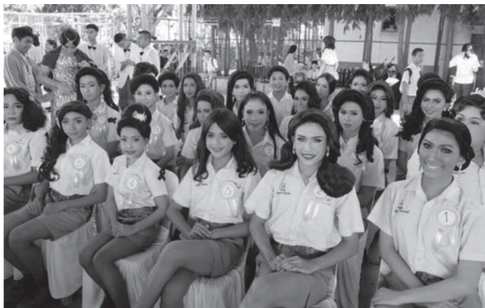
ภาพที่ 1: กิจกรรมประกวดนางงามกะเทยของโรงเรียนชัยภูมิภักดีชุมพล

โอกาสในการแสดงออกของกะเทย ถือเป็นสิ่งสำคัญ ที่บ่งบอกถึงตัวตน และแสดงถึงความสามารถของกะเทย สังเกตได้จากการเข้าร่วมกิจกรรมของกะเทยในโรงเรียนมัธยม หรือในสถานศึกษาระดับเดียวกัน ทุกกิจกรรมที่ปรากฏในสถานศึกษาเหล่านั้น เช่น การแสดงของชมรมนาฏศิลป์ และดนตรี งานแห่เทียนพรรษา งานกีฬา (เชียร์ลีดเดอร์ และขบวนพาเหรด) โดยอาจแบ่งรูปแบบการแสดงออกได้หลากหลายประเภท เช่น การแสดงนาฏศิลป์ไทย การแสดงละคร การเต้นประกอบเพลง (สากล ไทยสากล ลูกทุ่ง หมอลำ และเพลงตามกระแสนิยม) การเข้าร่วมและร่ายรำในขบวนแห่หรือขบวนพาเหรดประเภทต่าง ๆ การประกวดนางงาม การเป็นนางแบบในการนำเสนอเครื่องแต่งกายสร้างสรรค์ เป็นต้น กิจกรรมและรูปแบบการแสดงเหล่านี้ ล้วนมีกะเทยเข้าร่วมทั้งสิ้น อีกทั้งมีบทบาทสำคัญเสมอ ทั้งการแสดงเบื้องหน้า และการเป็นเจ้าหน้าที่เบื้องหลัง เช่น ผู้ควบคุมขบวนพาเหรด ผู้ถ่ายทอดท่าทางในการแสดง ผู้ออกแบบการแสดง ช่างแต่งหน้าทำผม หรือผู้ช่วยนักแสดงระหว่างมีการแสดง เป็นไปตามศักยภาพ หรือความถนัดของแต่ละบุคคล ซึ่งล้วนแต่เป็นการสั่งสมองค์ความรู้ด้านการแสดงทั้งสิ้น